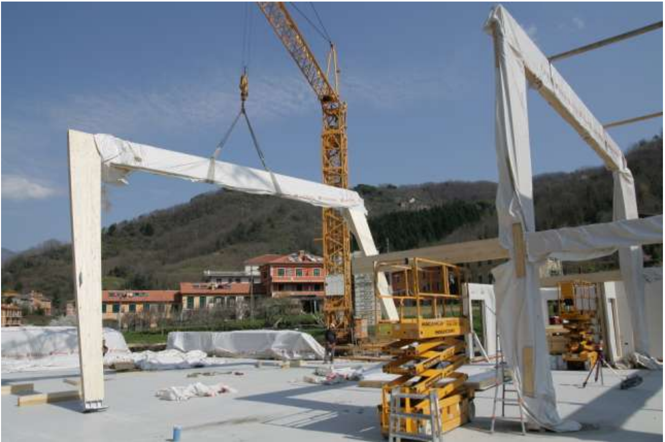
MONTAGGIO DEI PORTALI DELL'ATRIO E DELLA PALESTRA