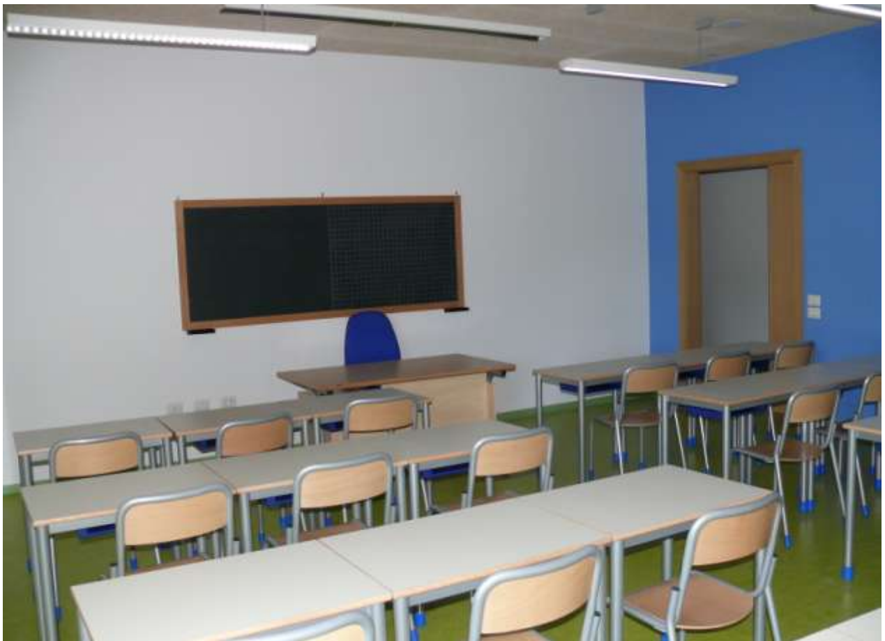
AULE SCUOLA PRIMARIA