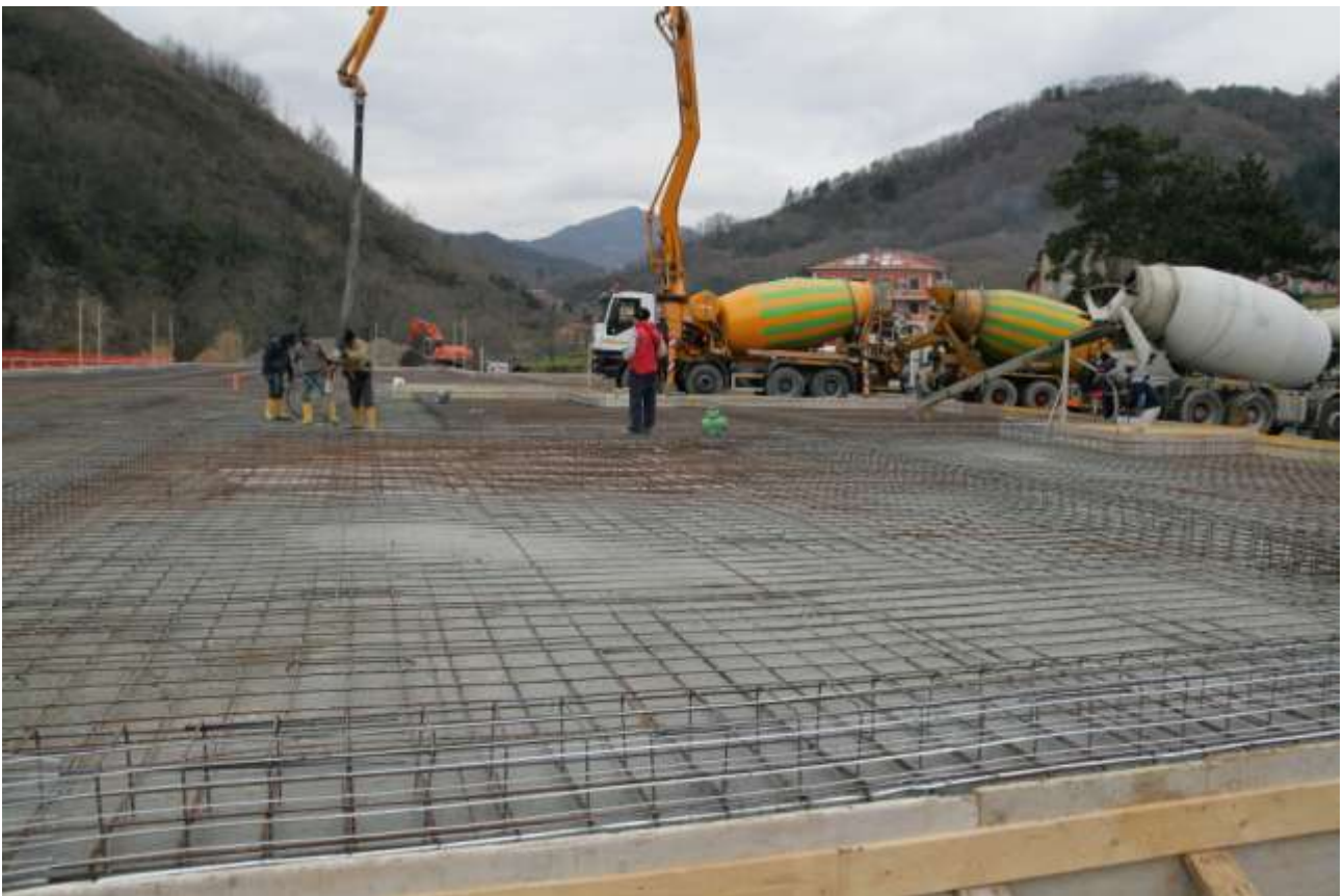
LA PLATEA DI FONDAZIONE