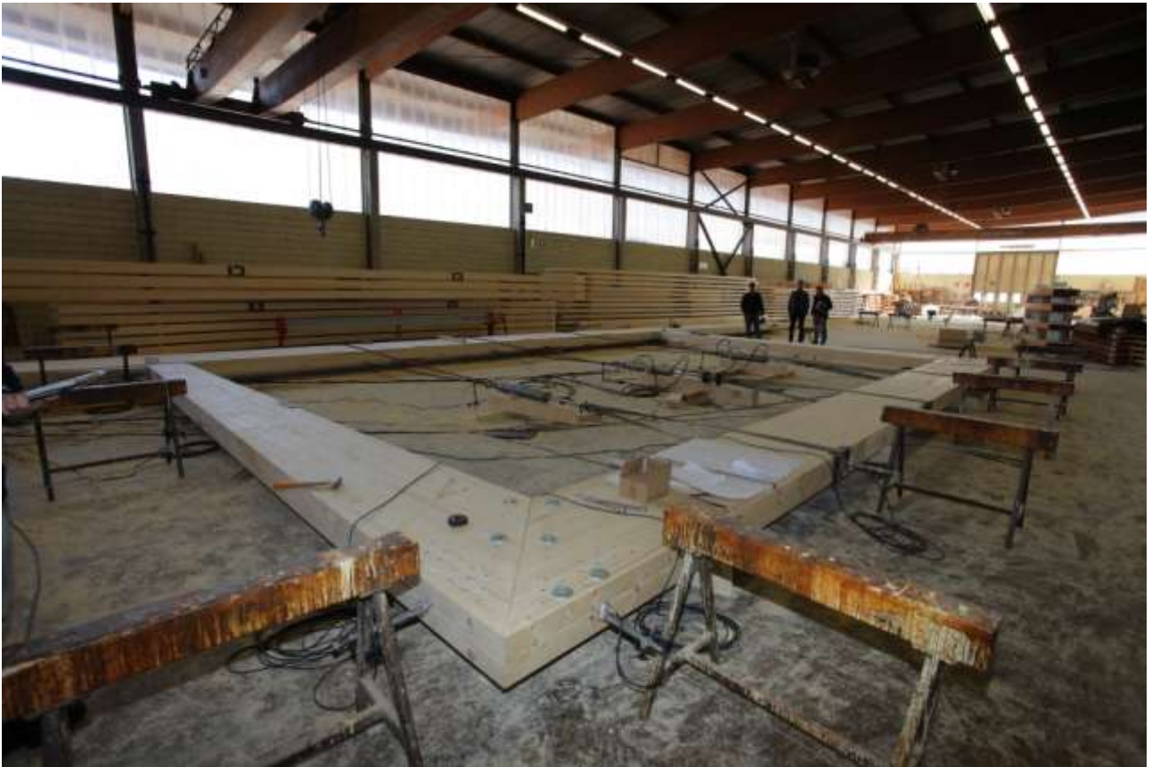
LA STRUTTURA IN LEGNO - IN STABILIMENTO