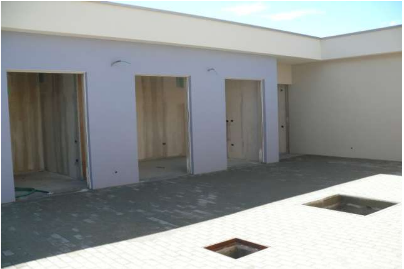
PRIME FINITURE ESTERNE