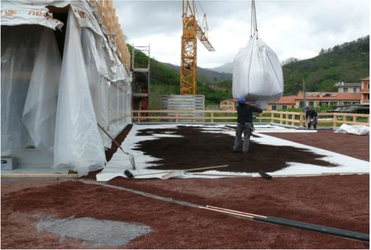
L'ALLESTIMENTO DEL "TETTO VERDE"