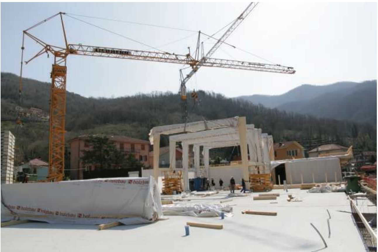
MONTAGGIO DEI PORTALI DELL'ATRIO E DELLA PALESTRA