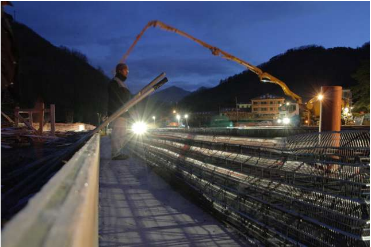
L'INIZIO DEL "GETTO" DELLA PLATEA DI FONDAZIONE