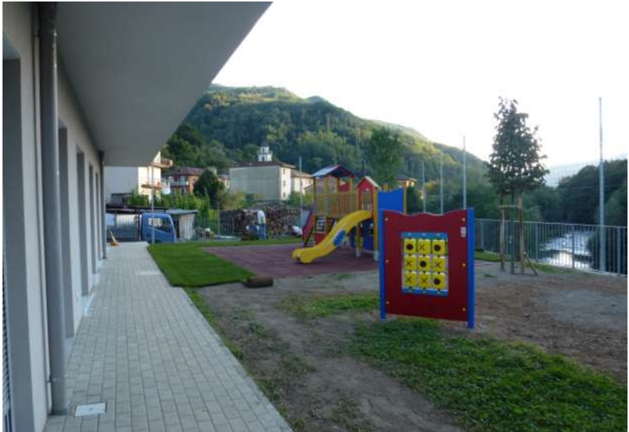
AREA GIOCHI ESTERNA