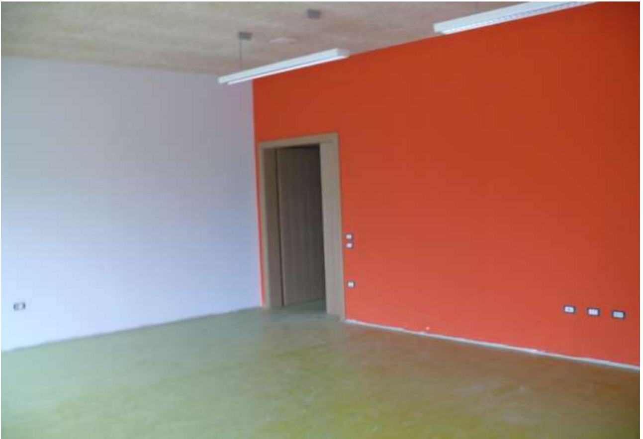
PRIME FINITURE INTERNE