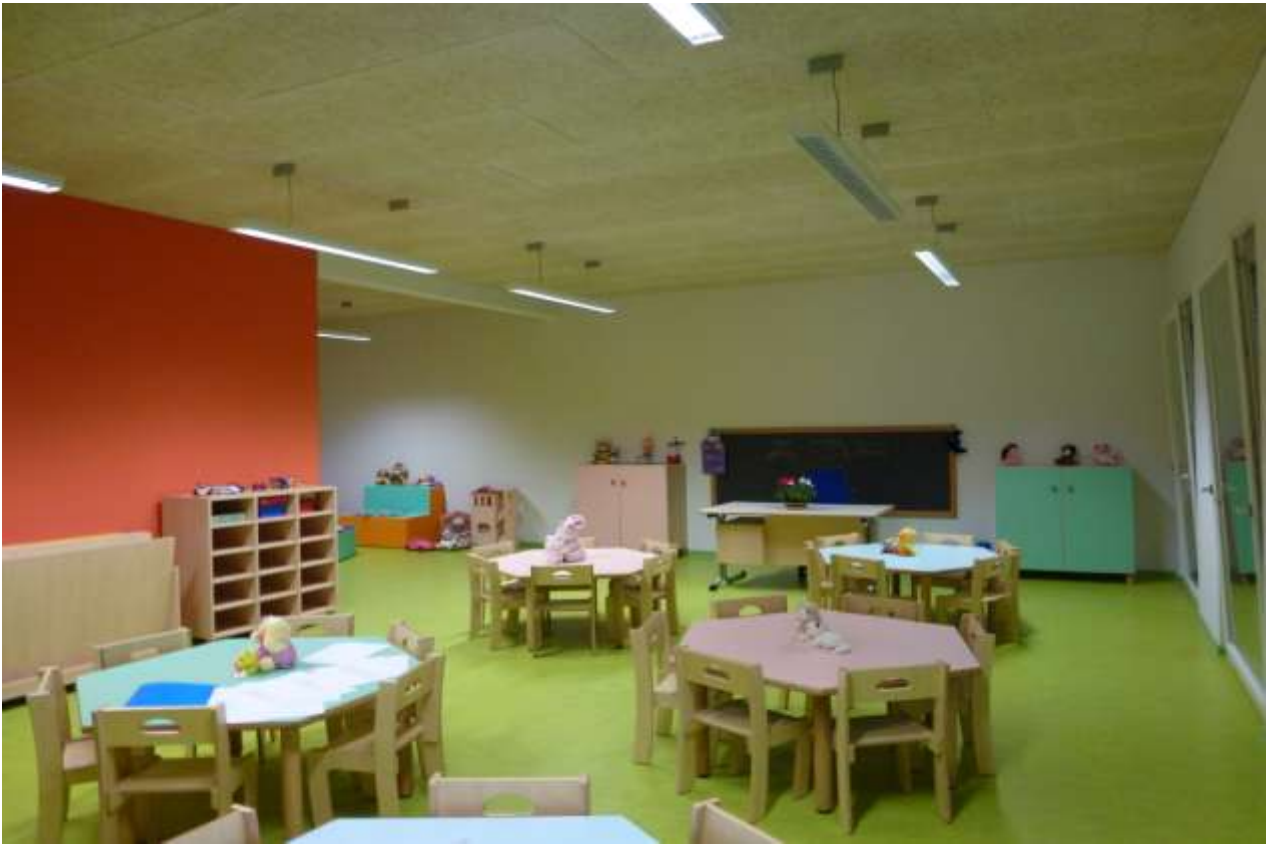
AULE SCUOLA DELL'INFANZIA